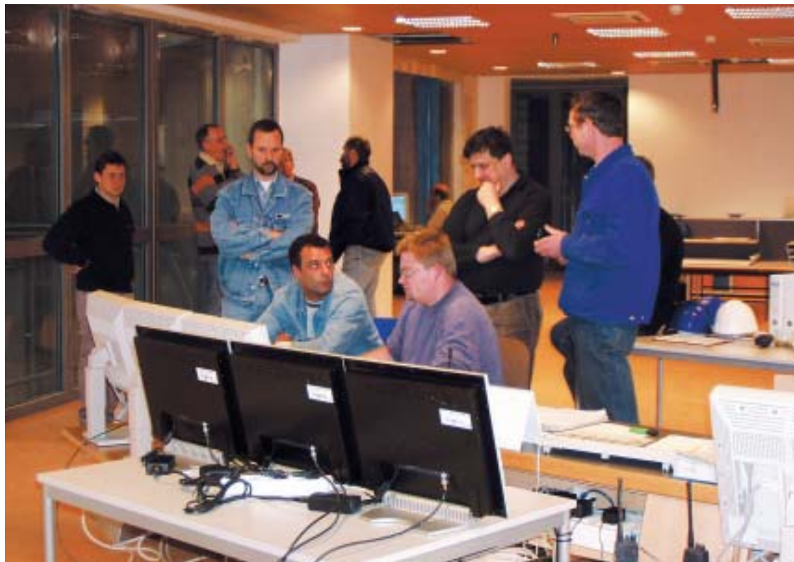
Auch Profi-Techniker zeigen manchmal Gefühle: Gespannte Gesichter beim Anfahren der AVN-Anlage mit dem ersten Müll.