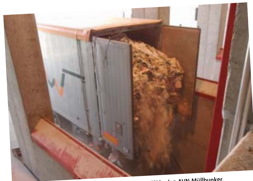
Entladung des ersten Mülls aus dem LKW in den AVN-Müllbunker.