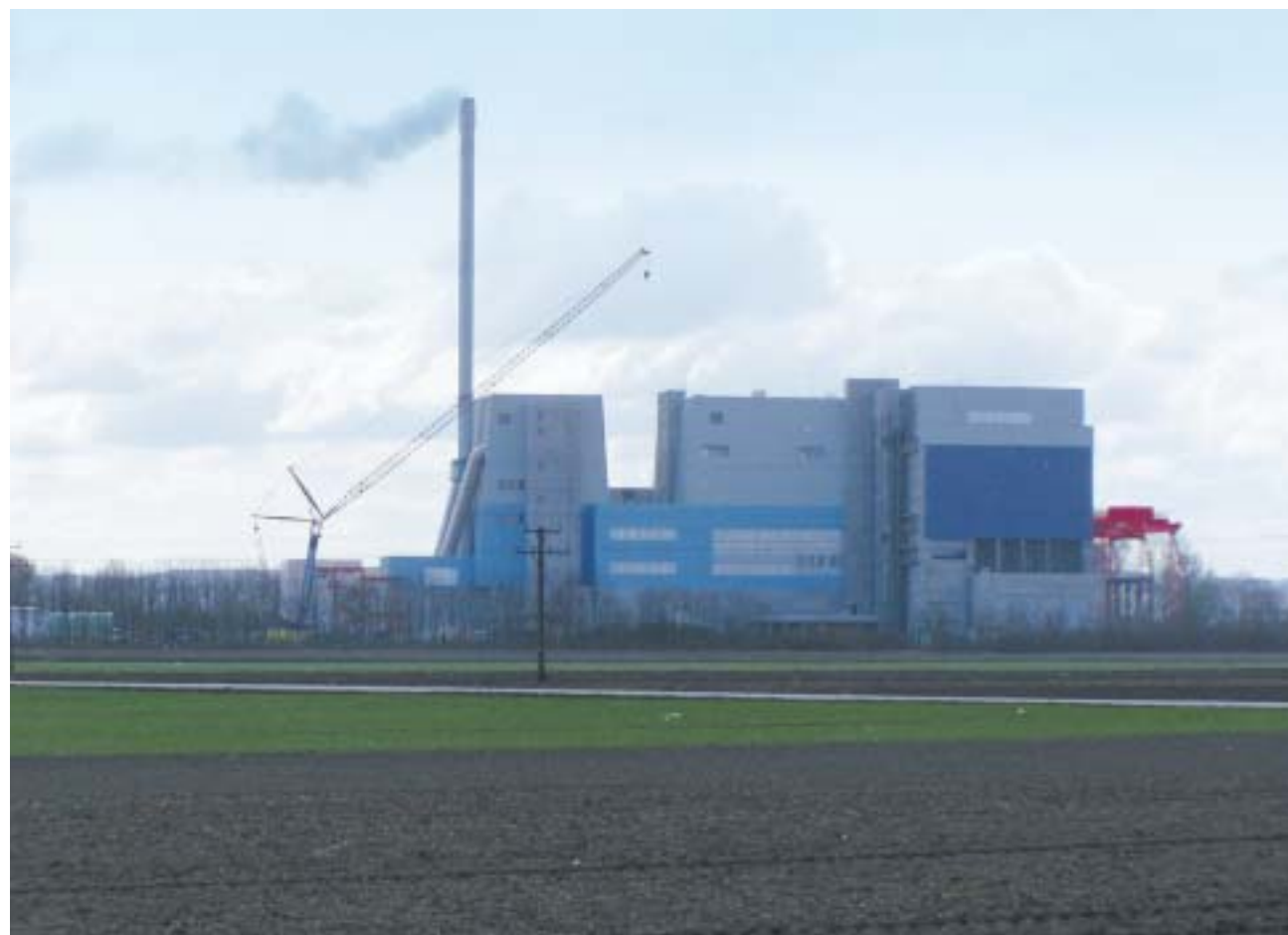
Fast wie bei der Papstwahl: Weißer Rauch steigt auf. Beim Müllfeuer der AVN-Anlage handelt es sich aber um nahezu reinen Wasserdampf, denn die Anlage hat nicht mehr Emissionen als drei LKWs.