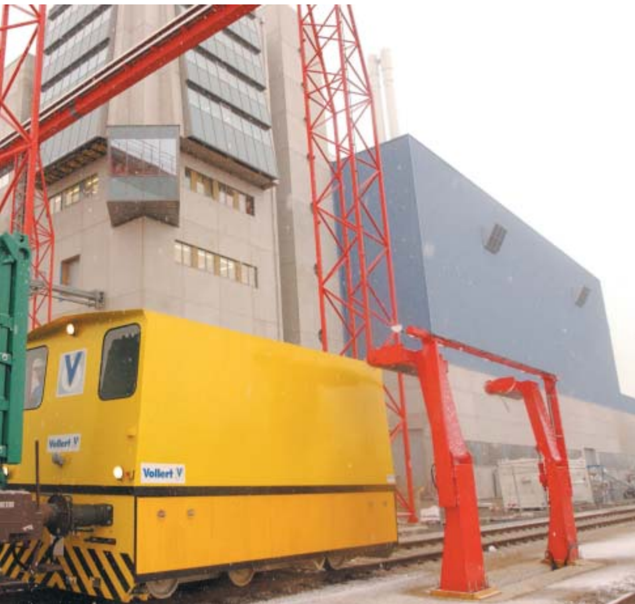
Schon während der Inbetriebsetzung kommt der Großteil des Mülls per Bahn. Ab 1.1.2004 werden 90 % der Abfälle von den Kunden mit Spezialcontainern auf der Bahn angeliefert.