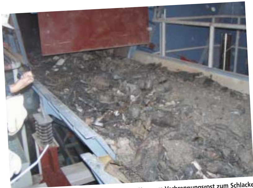
Die erste Schlacke am Förderband auf ihrem Weg vom Verbrennungsrost zum Schlackebunker: Durchschnittlich 250 kg davon fallen pro Tonne behandeltem Müll an.