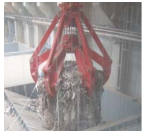
Der erste Greifer voll Müll vor seinem Abwurf auf den Verbrennungsrost.