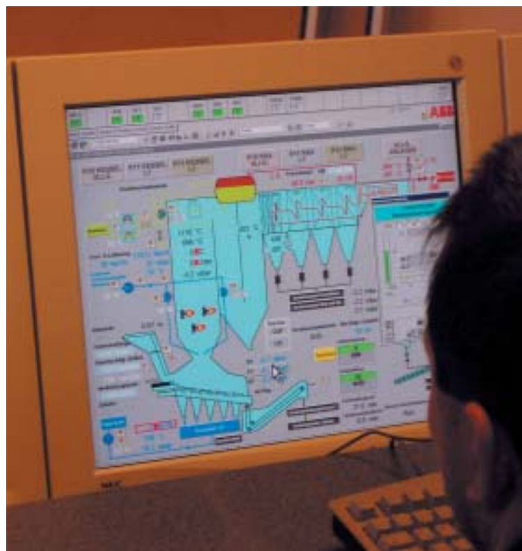
In der zentralen Steuerungswarte werden rund um die Uhr alle Abläufe in der Anlage genauestens überwacht.

lich nicht um einen Kessel wie zu Hause handelt, sondern um einen speziellen Müllkessel, müssen vor jedem Müllfeuer alle für den Betrieb erforderlichen Komponenten wie z. B. die Entaschung, der Schlacketransport, der Verbrennungsrost, die Kühlwasserversorgung usw. in Betrieb genommen werden. Auch die Dampflieferung zur Turbine im Kraftwerk Dürnrohr wird bereits mit dem Gasfeuer aufgenommen und die Turbine auf diese Weise zur Stromerzeugung angefahren. Bevor nun Müll aufgegeben werden darf, muß sichergestellt sein, daß der Müll schadstofffrei verbrennt, d. h. daß die Feuerraumtemperatur mindestens 850 Grad Celsius beträgt und die Abgasreinigung voll funktionsbereit ist. Wenn das gegeben ist, wird Müll in den Müllaufgabetrichter gefüllt und nach dem Öffnen einer Absperrklappe zum Rost geleitet. Durch die hohe Temperatur im Feuerraum infolge der Wärmestrahlung aus den Gasbrennern wird der Müll wie durch eine Fackel gezündet. Auf dem hydraulisch angetriebenen Rost wird der Müll dann von der Aufgabestelle zum Schlackeabwurf transportiert und auf diesem Weg vollständig verbrannt. Wesentli-