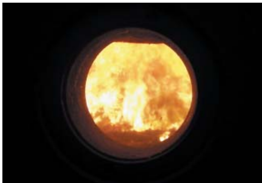
Die Einweihung der AVN-Anlage: Der erste Müll verbrennt langsam am Verbrennungsgrost des Müllkessels – ein Bild fast wie zu Hause vorm Kaminofen.

Wie bereits in der letzten „Bürger-Info“ im Februar 2003 berichtet, konnte die AVN schon am Beginn dieses Jahres mit der Kaltinbetriebsetzung der Müllverbrennungsanlage beginnen. Dabei wurden die einzelnen Funktionen der Anlagenteile in kaltem Zustand, also noch ohne Brennstoff, überprüft. Da ihr Zusammenspiel einwandfrei funktionierte, konnte die AVN Anfang März mit der Warminbetriebnahme beginnen. Dabei wurde zunächst Erdgas als Brennstoff eingesetzt, um nunmehr die Anlagenteile in warmem Zustand zu überprüfen. Auch dieser Schritt wurde erfolgreich durchgeführt. Und so kam schließlich am 5. April der große