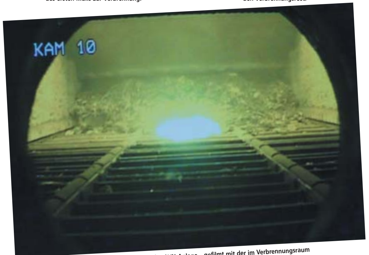
Der erste Müll verbrennt am Rost der AVN-Anlage – gefilmt mit der im Verbrennungsraum des Kessels montierten Kamera.