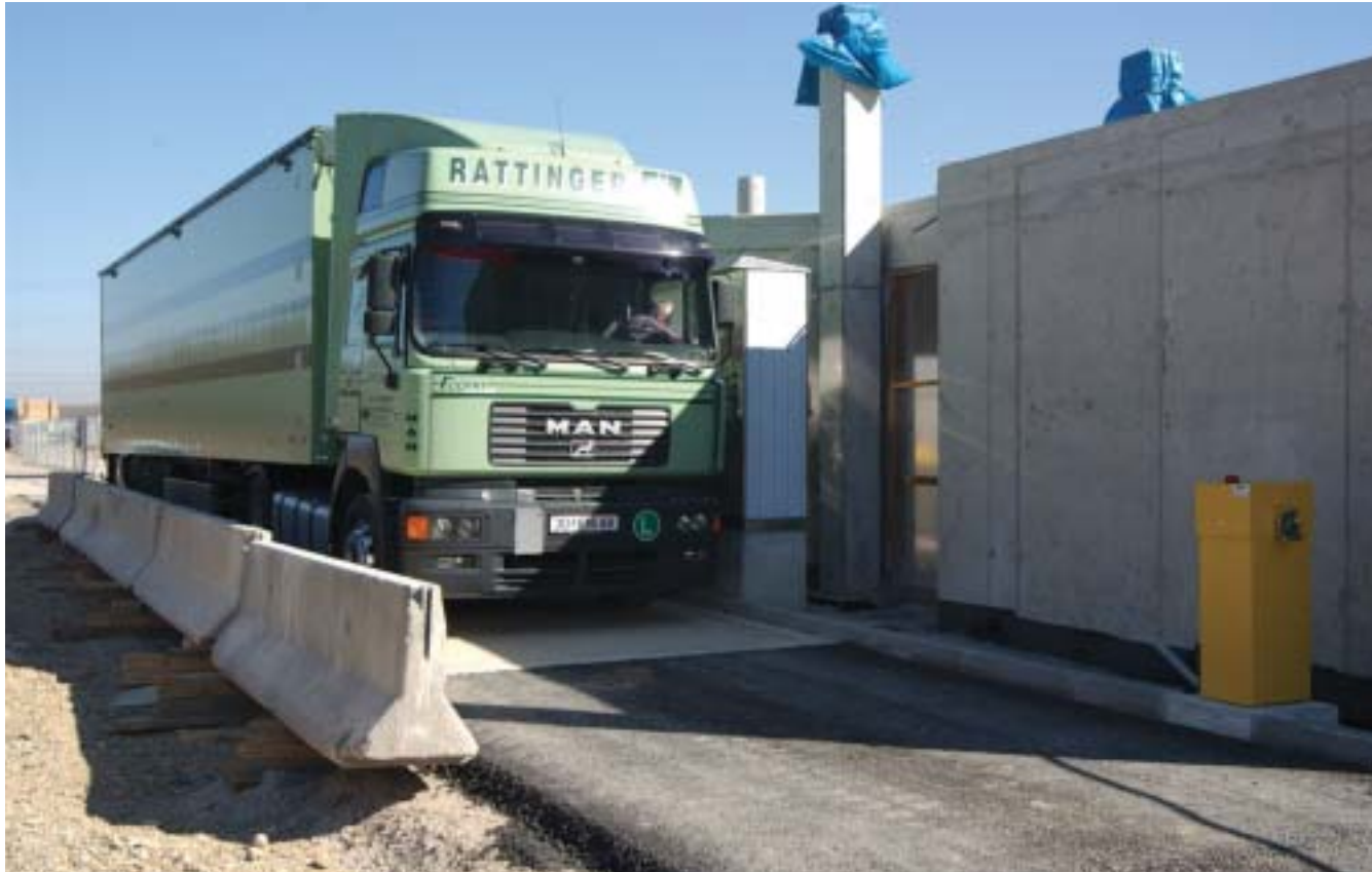
Der erste Müll-LKW am Eingang zur AVN-Anlage: In der ersten Phase der Inbetriebsetzung mit Müll kommt der Brennstoff per LKW, ab Juni wird die Bahnanlieferung in Betrieb genommen.