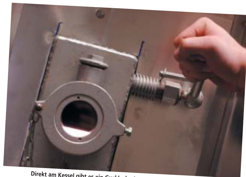
Direkt am Kessel gibt es ein Guckloch, durch das man das Müllfeuer beobachten kann.