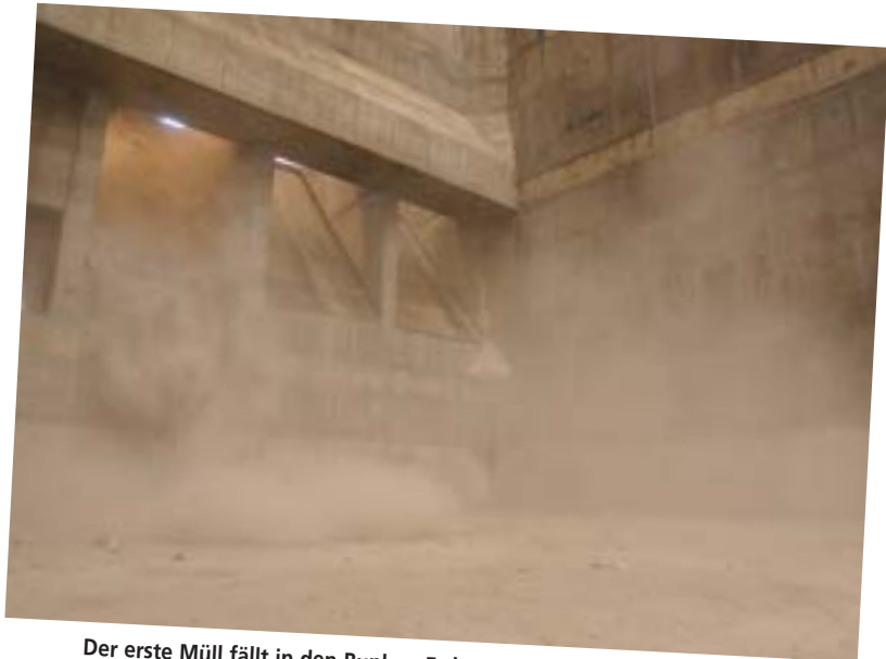
Der erste Müll fällt in den Bunker: Es handelte sich um sehr trockenen Sperr- und Gewerbeabfall.