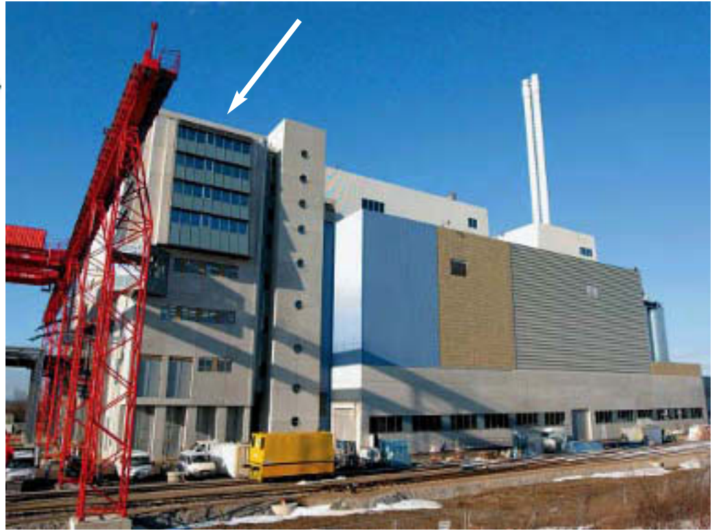
Im Bild links der Grundrißplan des AVN-Infocenters: Hier werden künftig die Präsentationen der AVN stattfinden. Im Bild rechts das Wartengebäude, in dessen letztem Stockwerk sich das Infocenter befindet. Um einen noch besseren Rundblick über die Anlage zu bekommen, wird in luftiger Höhe auch das Dach oberhalb des Infocenterraumes begehbare sein.

Fenster in den Müllbunker und in das Kesselhaus hat. So können die Gäste auf der rechten Seite des Ganges den Müllbunkerkrane bei seiner Arbeit beobachten und überblicken durch die Fenster links die beiden großen Kessel mit all ihren Verbindungsrohrleitungen. Zur Beschreibung der einzelnen Anlagenteile ist die Installation von in der Luft schwebenden Neonbeschriftungen geplant. Im Gang selber werden schlagwortartig die wichtigsten technischen Daten und Informationen (Kapazität der Anlage, Fassungsvermögen des Bunkers, Temperaturen im Kessel, Menge der Reststoffe usw.) plakativ präsentiert.