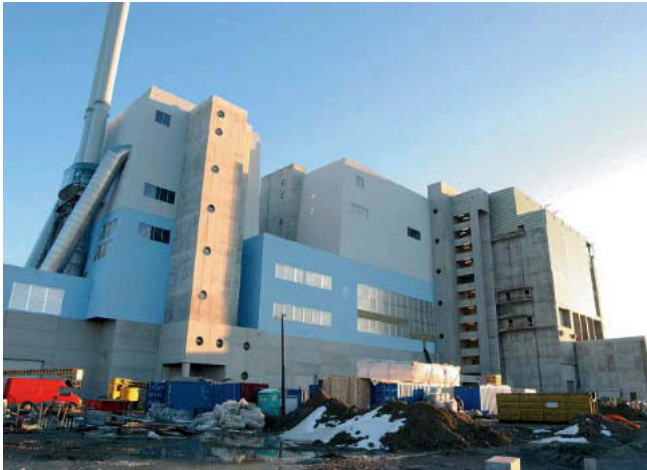
Die Vorderansicht der AVN-Anlage mit dem Eingangsbereich: Die Fassade ist geschlossen, die Anlage ist nahezu fertig, nur rundherum ist die Baustelle noch merkbar.