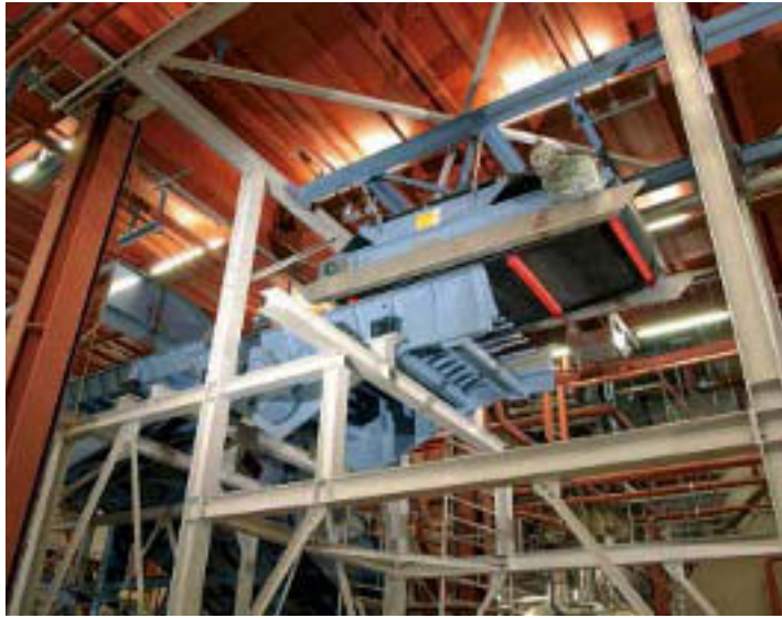
Fortsetzung von Seite 1

Dürnrohr. Denn die AVN liefert den bei der thermischen Verwertung des Mülls gewonnenen Dampf in das Kraftwerk Dürnrohr, wo daraus auf der Großturbine der EVN Strom erzeugt wird.